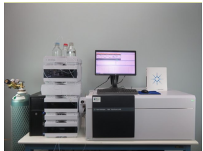
LC-MS : Chromatographie Liquide couplée à un détecteur de masse

Système de quantification de substances organiques non volatiles dans diverses matrices.