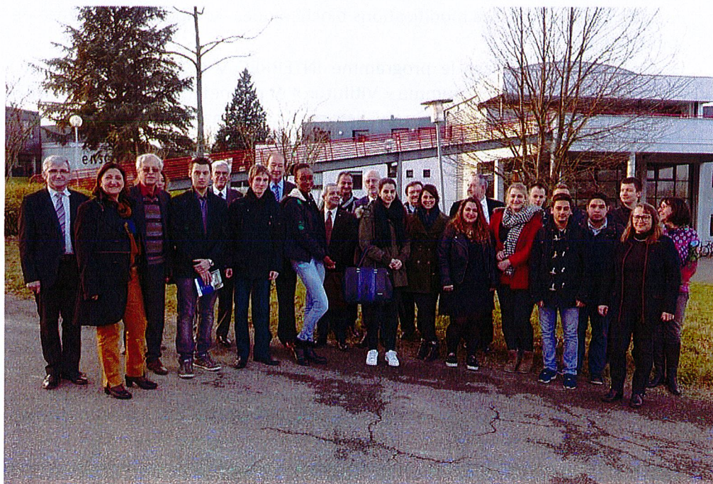
Promotion 2015/2016 Bourses Tremplin